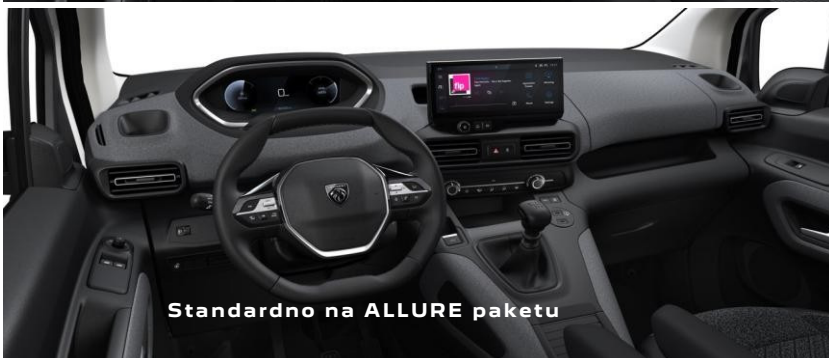
Standardno na ALLURE paketu