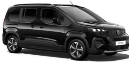
Crna Perla NERA