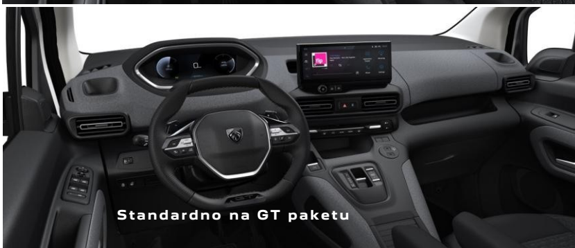
Standardno na GT paketu