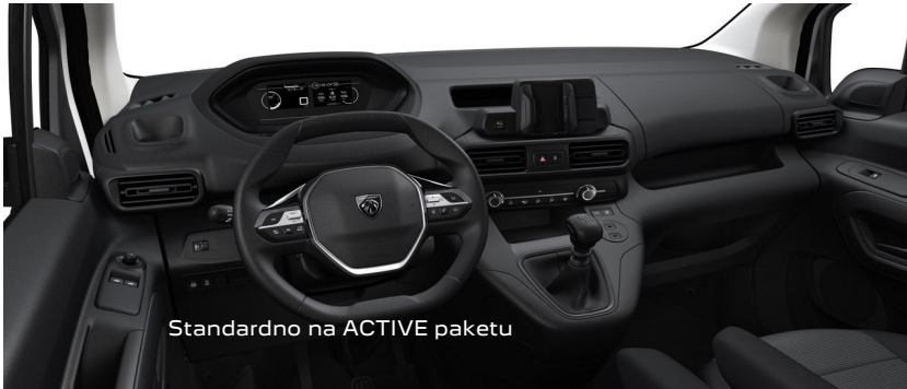
Standardno na ACTIVE paketu